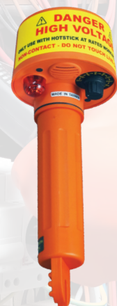
DÉTECTEUR DE HAUTE TENSION SANS CONTACT, MODÈLE 275HVD