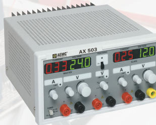
ALIMENTATION C.C., MODÈLE AX503