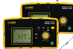
MODÈLES 6422 ET 6424

L'ensemble comprend l'adaptateur GroundFlex MD , modèle 6474 et modèle 6472. Le SEUL système sur le marché capable de tester la résistance de la mise à la terre de chaque pied de pylône de transmission électrique!