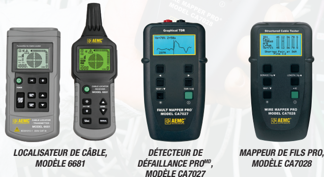
LOCALISATEUR DE CÂBLE, MODÈLE 6681