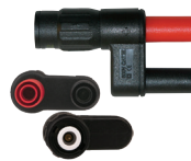
ADAPTEUR – BANANE (FEMELLE) – BNC (MÂLE) (XM-BB) POUR CAPTEURS AMPFLEX, MODÈLES K100/ K110 ET ENREGISTREURS DE DONNÉES SLII