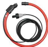
CAPTEUR AMPFLEX MD , MODÈLE 196A-24-BK POUR MODÈLES 8435, 8436 ET PEL 105