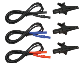
FILS DE RECHANGE AVEC PINCES POUR MODÈLES 6608 ET 6609