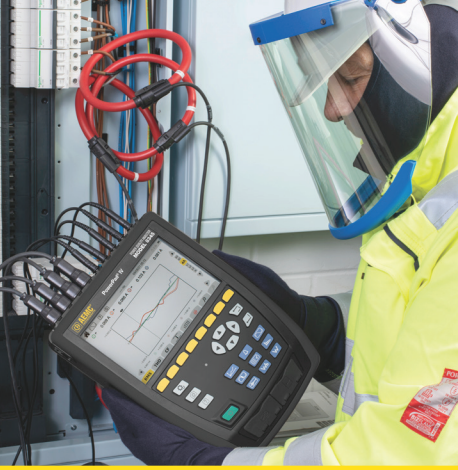
POWERPAD IV Class A POWERPAD MD , MODÈLE 8345