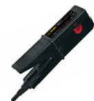
SONDE DE COURANT C.A., MODÈLE MN01