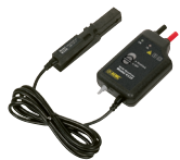
MICRO-SONDE C.C./C.A., MODÈLE K110

(Beaucoup d'autres modèles disponibles! Consultez le site Web pour connaître tous les modèles)