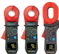
MODÈLES 6416, 6417, 6418