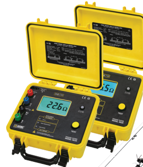
MODÈLES 4620 ET 4630

Nos pinces révolutionnaires pour tester la résistance de mise à la terre vous feront gagner du temps et de l'argent en vous permettant de mesurer la résistance sans déconnecter le système de mise à la terre!