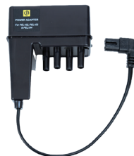
ADAPTEUR – ADAPTEUR CONVERTISSEUR DE PHASE, 600 V CAT III, POUR MODÈLES PEL 102 ET PEL 103

Notre gamme d'accessoires couvre un éventail d'applications, des multimètres aux sondes d'oscilloscope en passant par les analyseurs de puissance et les caméras thermiques. De plus, nos accessoires sont conçus selon les normes les plus élevées de l'industrie, vous assurant ainsi d'effectuer des tests en toute confiance, sachant que vous et votre équipement êtes protégés. Quelle que soit la complexité de votre configuration électrique, nous avons l'outil et l'accessoire appropriés pour simplifier vos processus d'essai. Tous les accessoires sont disponibles sur notre site Web!