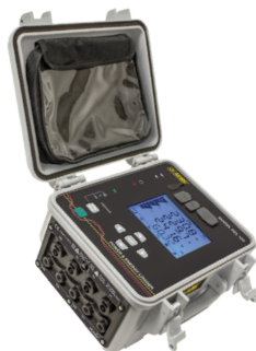
ENREGISTREUR DE PUISSANCE ET D'ÉNERGIE, MODÈLE PEL 105