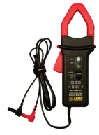
SONDE DE COURANT C.A./C.C., MODÈLE MR526 (FICHE BANANE)