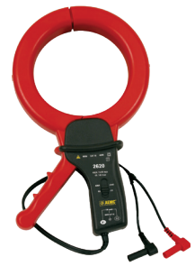
SONDE DE COURANT DE FUITE, MODÈLE 2620