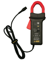
SONDE DE COURANT C.A./C.C., MODÈLE MR417 (CONNECTEUR BNC)