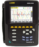
POWERPAD MD , MODÈLE 8336