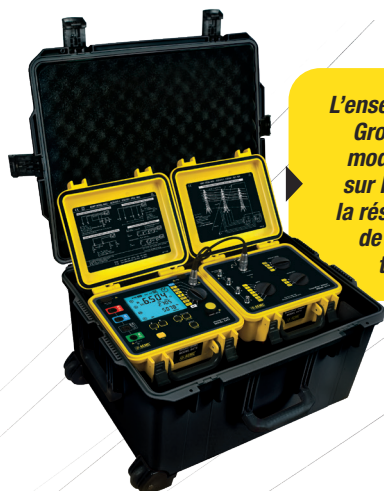
TROUSSE D'ANALYSE GROUND FLEX MD , MODÈLE 6474

L'ensemble comprend l'adaptateur GroundFlex MD , modèle 6474 et modèle 6472. Le SEUL système sur le marché capable de tester la résistance de la mise à la terre de chaque pied de pylône de transmission électrique!