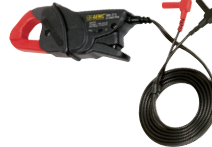
SONDE DE COURANT C.A., MODÈLE MN373