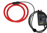
CAPTEURS FLEXIBLES AMPFLEX MD