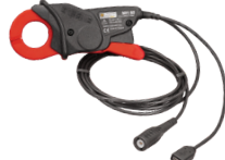
SONDE DE COURANT C.A./C.C., MODÈLE MH60