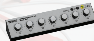
BOÎTE DE RÉSISTANCE À DÉCADE, MODÈLE BR07