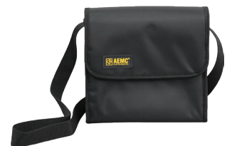
POCHETTE DE TRANSPORT POUR TESTEURS DE CÂBLE, MÉGOHMÈTRES, MULTIMÈTRES, ETC.