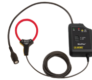
CAPTEURS FLEXIBLES MINIFLEX MD