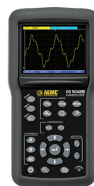
MODÈLE OX 5042B

Trois instruments de mesure en un! (Multimètre numérique, oscilloscope 2 canaux et analyseur harmonique)