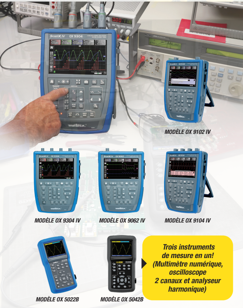
MODÈLE OX 9102 IV

(Consulter le site Web pour tous les modèles)