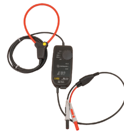
MINIFLEX MD 14 PO, MODÈLE MA114

Nous offrons des sondes personnalisées pour répondre aux besoins de votre application. Il suffit de nous faire part de vos besoins précis! Pour commencer, rendez-vous sur notre site Web www.aemc.com , cliquez sur l'onglet Soutien et remplissez le formulaire de Service à la clientèle .