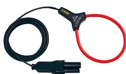
CAPTEUR MINIFLEX MD , MODÈLE MA193-10-BK POUR MODÈLES 3945-B, 8220, 8230, 8333, 8335, 8336, 8345, 8435 ET LA SÉRIE PEL