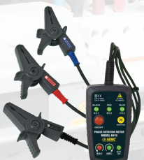
COMPTEUR DE ROTATION DE PHASE, MODÈLE 6610