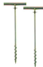
ÉLECTRODES AUXILIAIRES EN T DE MISE À LA TERRE EN ACIER INOXYDABLE DE 17 PO